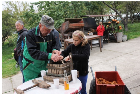
Den otevřených dveří Biofarma Juré