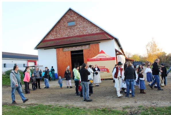
Den otevřených dveří Ekofarma Vrbětice