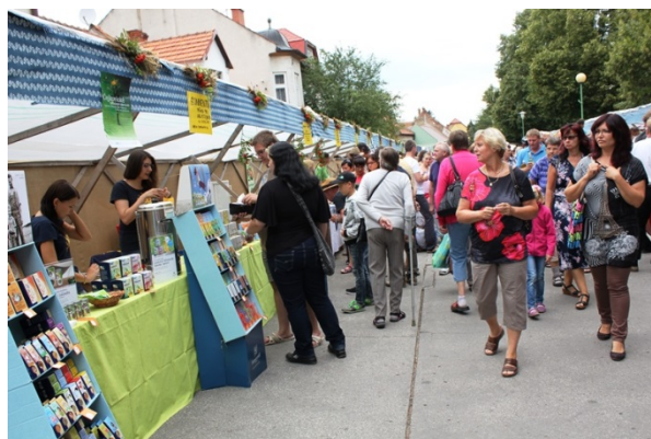
Biojarmark Velká nad Veličkou